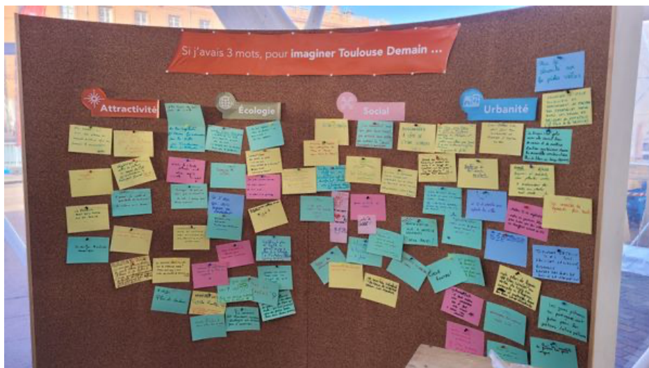
Quelques contributions recueillies au forum Toulouse Demain.

Il déplore notamment que des associations invitées aient refusé de venir participer aux tables rondes organisées. Toulouse Actions Citoyennes répond ne pas avoir reçu une telle invitation. Résultat, l'essentiel des intervenants sont issus du secteur du bâtiment : architectes, urbanistes, promoteurs et constructeurs. "Ca sent le greenwashing à plein nez ", juge à la sortie du forum Matthieu, chercheur à l'université Paul Sabatier, venu en curieux assister aux débats. "Ils parlent en fait du développement de leur business demain, pas tant de l'avenir de la ville."