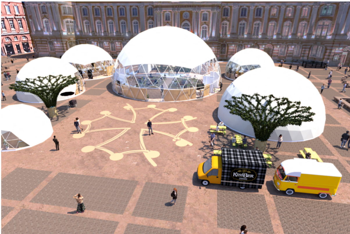
Cet espace de près de 10 000m2 accueillera l'ensemble des animations, expositions, conférences et ateliers.

Bruno Cavagné tient à le préciser, cette consultation « est là pour capter les sensibilités des différentes parties prenantes, que ce soient les habitants, les institutions, les élus, afin de leur permettre de s'exprimer dans le but de pouvoir construire des orientations et d'imaginer ensemble un avenir désirable ».