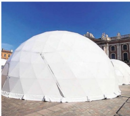
Une des géodes de « Toulouse Demain », place du Capitole.

Pour le maire de Toulouse et président de la métropole, « il s'agit de faire la ville de demain en