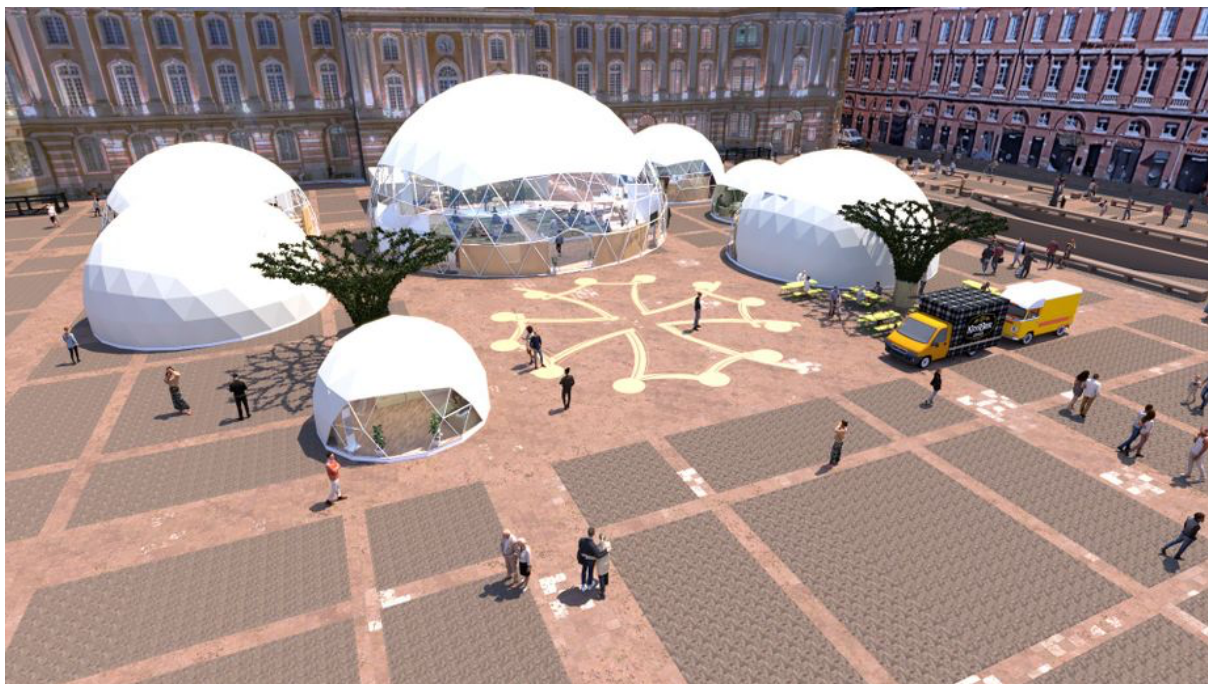
Plus de 10000 visiteurs sont attendus durant les trois jours de forum. Médiane

C'est à l'intérieur de géodes dont une géante de 400 m 2 et des plus petites de 100 m 2 que se tiendront conférences, tables rondes et ateliers. Au programme de ces trois jours, une exposition présentant les projets urbains des grandes métropoles européennes comme Genève, Bristol, Nantes, Lyon... pour inspirer le futur développement de Toulouse. « Les débats iront de la grande échelle 'quel périmètre pour la métropole demain' jusqu'à l'îlot de quartier pour réfléchir au logement » explique Jacques Rosen, ancien directeur de l'aménagement de Toulouse Métropole. Briques en terre crue, béton de chanvre, immeuble sans chauffage... les innovations pour construire différemment seront également partagées durant le forum.